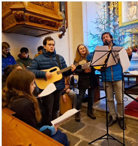
Silvestrovské chvály u kapucínů.

Rok 2025 jsme zakončili silvestrovskými chválami. O hudební doprovod se postaraly místní Malé chvály, pak jsme ještě mohli využít nabídku silvestrovského posezení na faře.