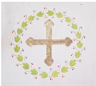
Konsekrační kříž z Nalžovských Hor.

mě slavit Boží tajemství, ať dojdeme do nebeského Jeruzaléma, kde tě budeme navěky chválit.“