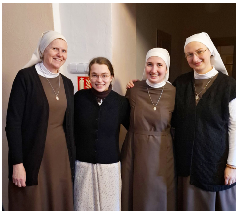
Řeholní sestry ze Strážova.