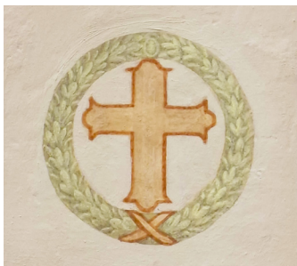
Konsekrační kříž z kláštera.