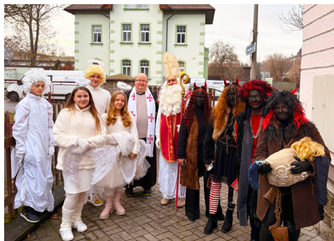
Putování se svatým Mikulášem.

slané poznámky rodičů). Možná je zajímavé zmínit, jakou tam má kapucín roli, když přece sv. Mikuláš je biskup. Nicméně světec z Myry pokorně přenechává knězi závěrečné požehnání pro rodinu.