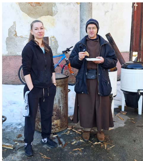
Bratři si zabijačku užili naplno.