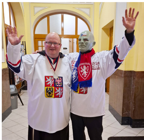
Nečekaná setkání na farním karnevalu.