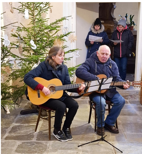
Zpívání u jesliček.

jako tři králové. Hledání betlémské hvězdy nás vřdycky zavede do širšího okolí. Nemůže chybět už klasická momentka v rejštejské hasičárně.