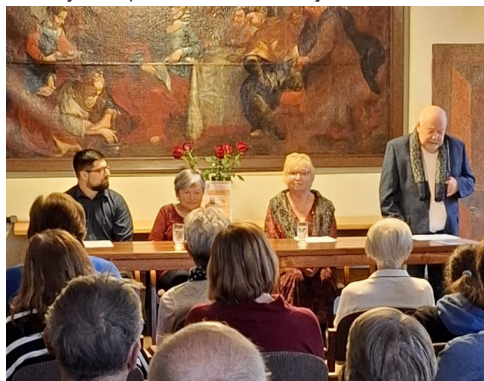
Pocta Jaroslavu Seifertovi.

Téměř vzápětí (21. 4.) jsme se mohli zaposlouchat do veršů Jaroslava Seiferta a do tónů v podání houslového tria Šumava Strings. Literární a hudební večer byl koncipovaný jako pocta tomuto nositeli Nobelovy ceny za literaturu, neboť letos je to právě 40 let od jeho úmrtí. Za-